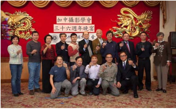
董事及執委向會眾祝酒