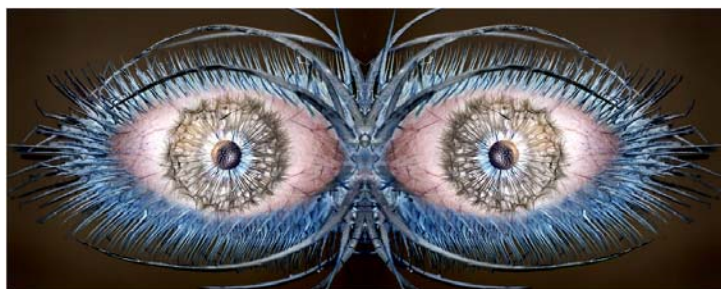
亞軍 Tam Chi Yin Weed