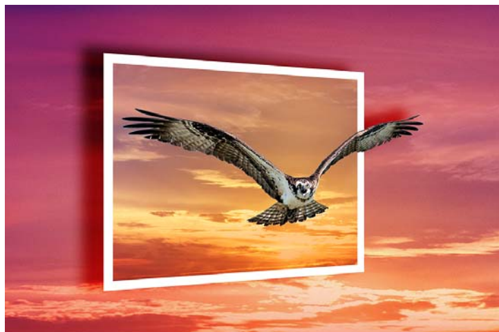
季軍 Stanley Wong Fly away