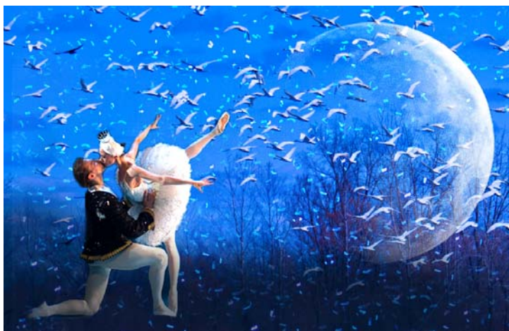
優異 Dorothy Chan Swan Lake