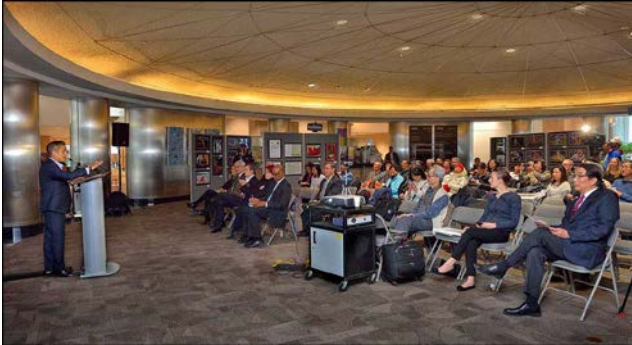
亞裔月[藝術與攝影展覽] 市政局開幕典禮現場