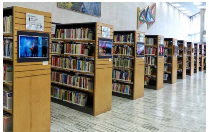
亞裔月[藝術與攝影展覽] 大會堂圖書館展覽場