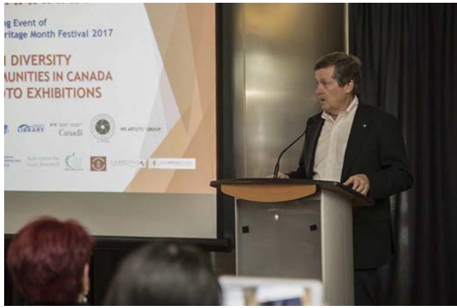
多倫多市長莊德利於開幕典禮致詞