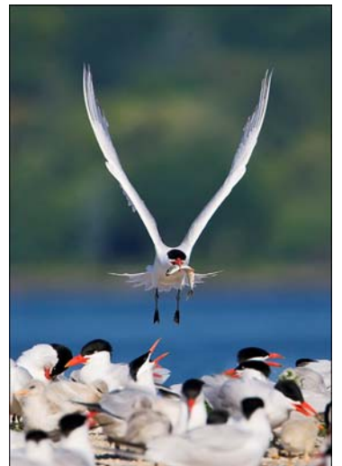
Caspian tern Return with Fish