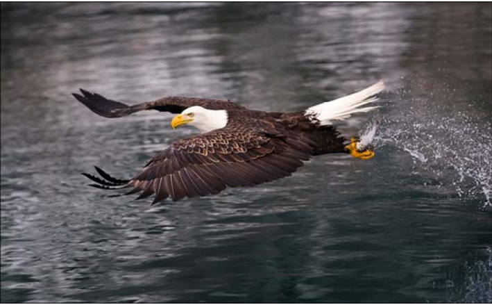
Bald Eagle Catching Fish

每張作品都展現出捕捉一瞬間的技巧，用不同焦距拍攝。作品展示方法，考慮到雀鳥的活潑性、不同光源、不同剪裁形狀，以確保全套作品在和諧、色調上的配合。