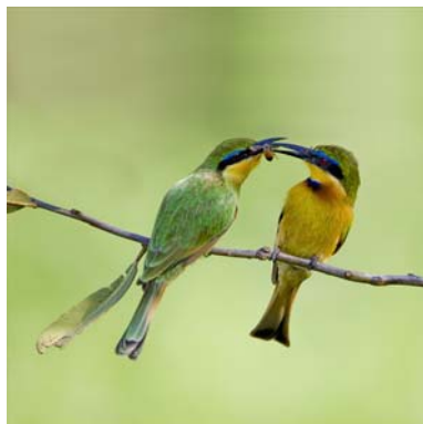
Little Bee-eater Sharing