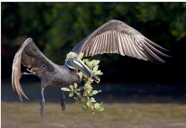
Brown Pelican with Branch