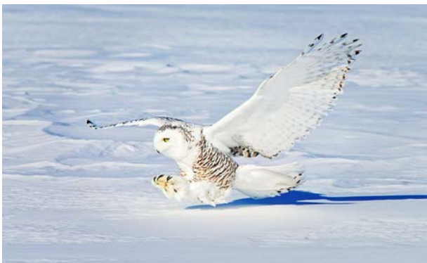
Snowy Owl Landing