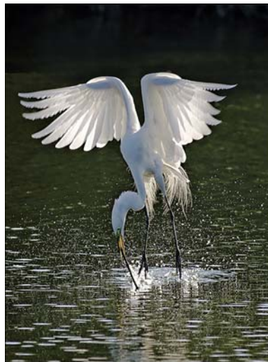
Great Egret Pick up stick