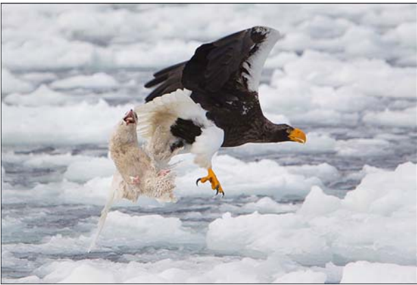
Steller's Sea Eagle with gull