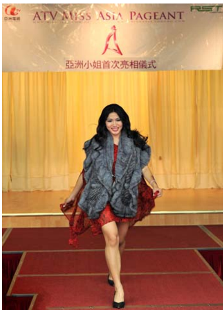
最佳攝影獎 Edwin Ho