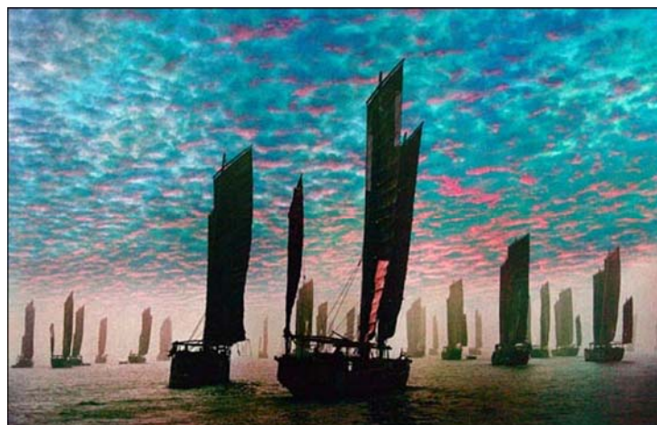
《一湖春水曉帆風》 簡慶福