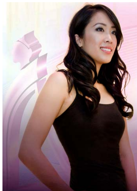
最佳創作攝影獎 Dorothy Chan