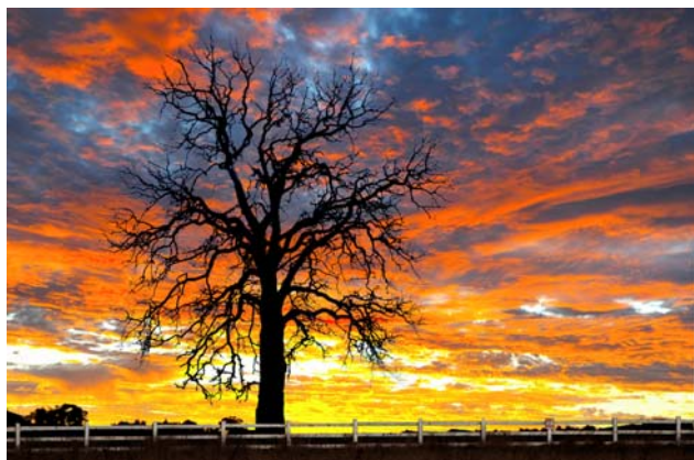
The morning after storm

以下是會友馮勁文 (Ray Fung) 考獲本會 2012 年度會士銜 (ACCPS) 之部份作品。