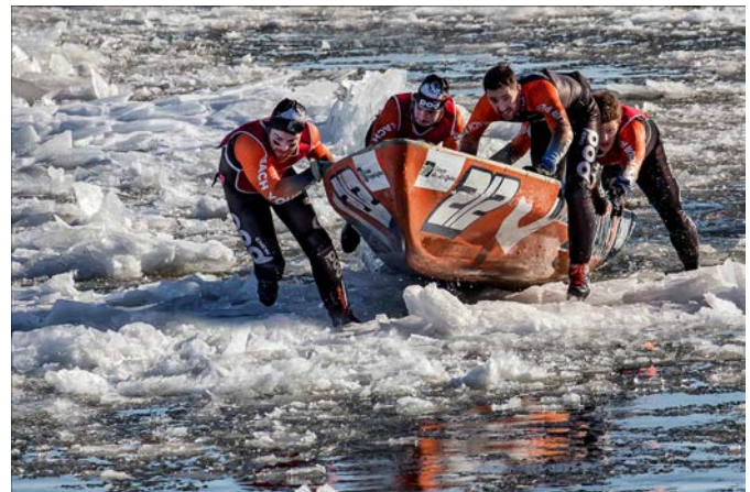
Team Work Canadian Style