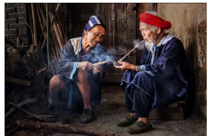
Long Time Friends