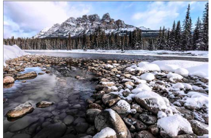
Winter Castle Mountain