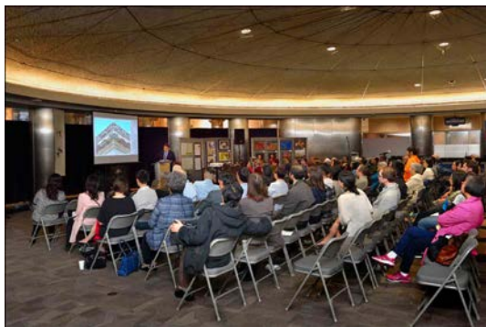
[藝術與攝影展覽] 開幕典禮現場