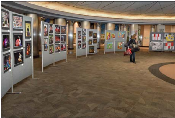
[藝術與攝影展覽] 市政局展覽現場