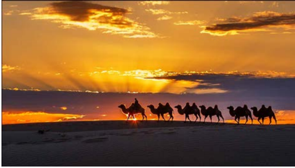
Sunrise in the Desert