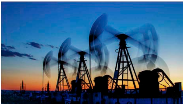
Sunset in the Oil Field