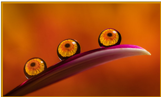
甲組優異 Katie Mak – water drop photography

是次比賽分甲組及乙組，結果每組各選出金牌、銀牌、銅牌及兩個優異作品五張，每一獲獎作品，均獲得董事陳丹青，送出之週年晚宴餐券乙張，以資鼓勵。