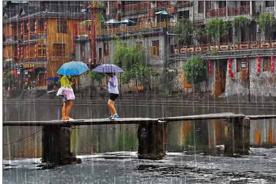
乙組銀牌 Zachary Mak – Rainy day commute