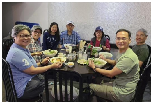
參加街頭攝影活動之會友在酒家午膳