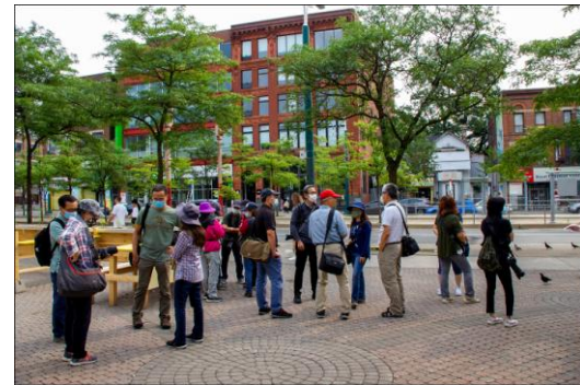
參加街頭攝影活動之會友