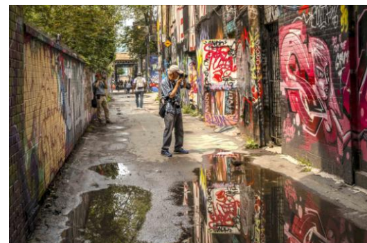
會友在塗鴉巷獵影