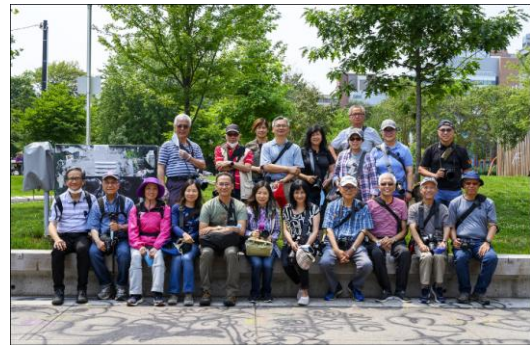
參加 Kensington Market 街頭攝影活動會友合照