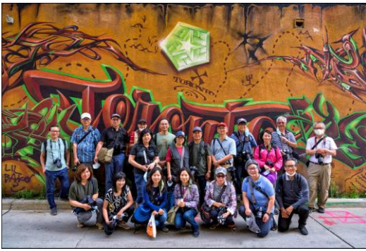
參加塗鴉巷 Graffiti Alley 街頭攝影活動會友合照