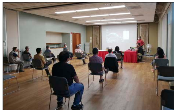
於中華文化中心講解拍攝花卉的基本知識