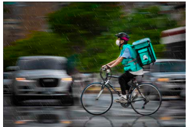
銅牌 Florence Lau Fantuan delivery during Covid