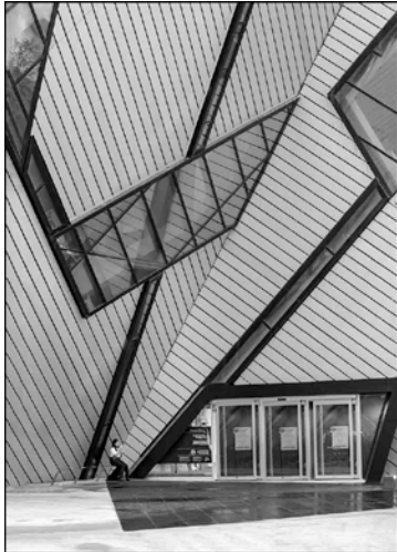
金牌 Florence Lau Waiting