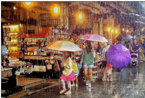
銀牌 Zachary Mak Family shopping on a raining day