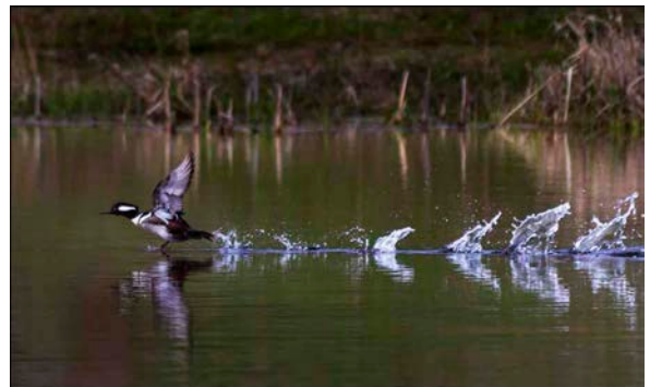
優異 Chu Wan Tat Take flight