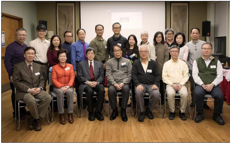
董事、顧問及執委合照