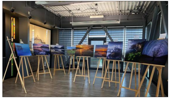
[大地之旅] 巡迴展覽於 Calgary 展出現場