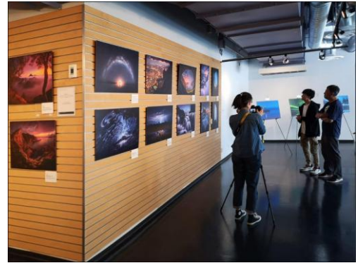
[大地之旅] 加拿大巡迴展覽在 Vancouver 展出