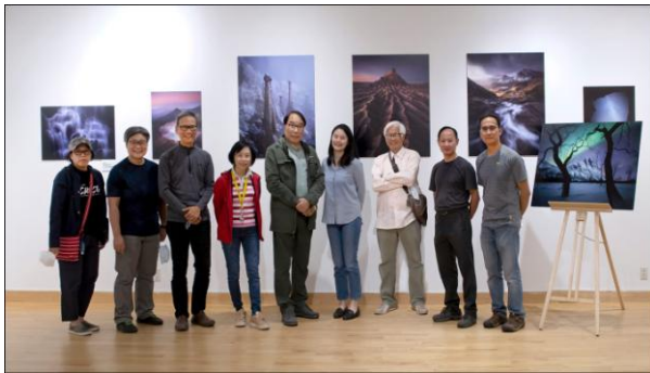
[大地之旅] 於文化中心展出, 負責佈置之會友合照