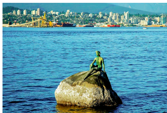
甲組銅牌：Percy Lo - Vancouver