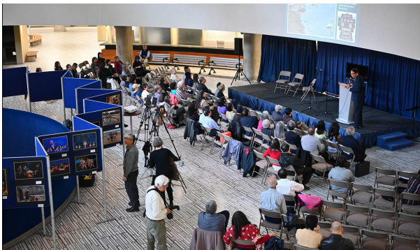
亞裔傳統文化月於 May 11 在多倫多大會堂舉行開幕典禮現場