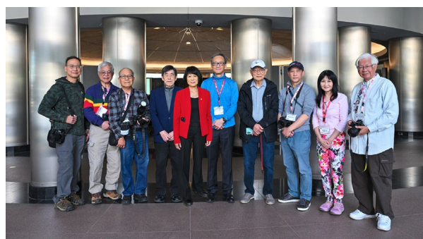
市長鄒至蕙(左五)於市政廳大堂前與會友合照