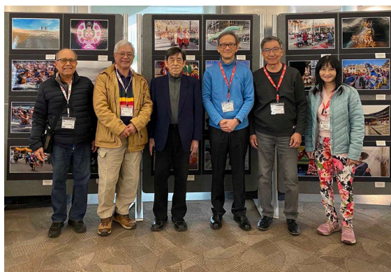
亞裔月會員作品展覽場工作人員合照