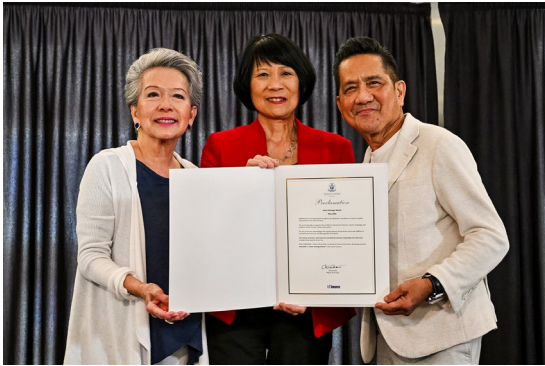
展示市長鄒至蕙發表之亞裔傳統文化月公告