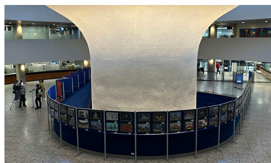
亞裔月會員作品於大會堂展覽現場