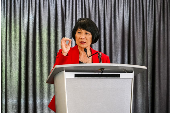
市政廳大堂開幕典禮市長鄒至蕙致詞