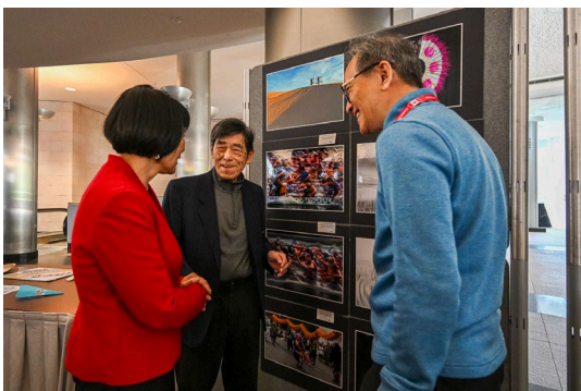
顧問譚錦超會長劉志豪陪同鄒市長參觀展覽